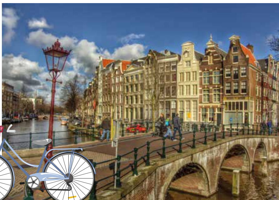
Brücke, Grachten, Giebelhäuser: Amsterdam wie aus dem Bilderbuch.

Vielleicht liegt Amsterdams Magie genau in dieser Spannung: zwischen prachtvoller Vergangenheit und hochaktuellen Debatten, zwischen Museum und Musikclub, zwischen ruhigem Morgenlicht auf der Prinsengracht und dem vollen Gedränge am Nachmittag. Es ist eine Stadt, die nicht nur „schön“ sein will, sondern lebendig – manchmal anstrengend, oft überraschend, fast immer inspirierend. Und wenn du am Ende einer Grachtenfahrt unter einer der vielen Brücken hindurchgleitest, denkst du wahrscheinlich das, was hier viele denken: Einmal reicht nicht.