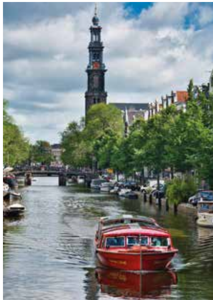
Grachtenboot vor Kirchturm: so malerisch zeigt sich Amsterdam.

reiner Freiheit, zumindest an neuralgischen Orten.