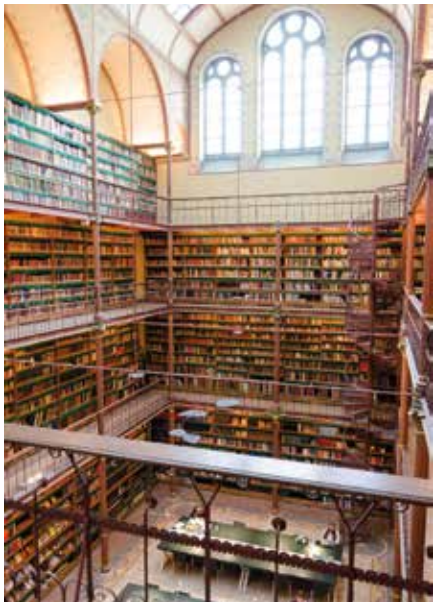
Die Cuyper-Bibliothek im Rijksmuseum verzaubert mit historischem Flair.

abbiegen darf. Klassiker wie Rijksmuseum und Van-Gogh-Museum liefern Weltklasse, aber fast genauso schön ist das, was dazwischen passiert: ein Kaffee in den „Nine Streets“ (jenen 3 x 3 Gassen zwischen der Prinsen-, Keizers- und Herengracht), Vintage in De Pijp, ein Streifzug durchs Jordaan-Gassenlabyrinth – und überall das Wasser als Orientierungslinie.