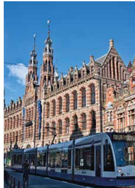
Backstein, Türme, Tram: Amsterdams Hauptbahnhof zieht die Blicke auf sich.

Amsterdam ist längst nicht mehr nur Sehnsuchtsort, sondern auch Beispiel dafür, wie aus beliebt „zu beliebt“ werden kann. 2024 gab es in der Stadt rund 23 Millionen touristische Übernachtungen – und damit mehr als das, was die Stadt eigentlich als Zielmarke ausgerufen hatte. Die Reaktion darauf: Amsterdam versucht, den Massentourismus zu bremsen, etwa mit strengeren Regeln, wie beispielsweise einem Stopp für neue Hotels, wenn sie nicht an anderer Stelle ersetzt werden.